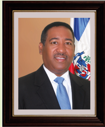
LICDO. NICOLÁS CALDERON GARCÍA ADMINISTRADOR GENERAL DE COMEDORES ECONÓMICOS DEL ESTADO -ACTUAL-