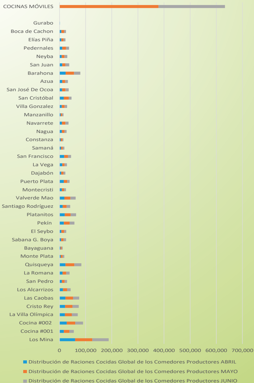
Distribución de Raciones Cocidas Global de los Comedores Productores