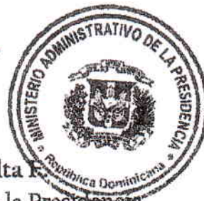
José Ramón Peralta Ministro Administrativo de la Presidencia