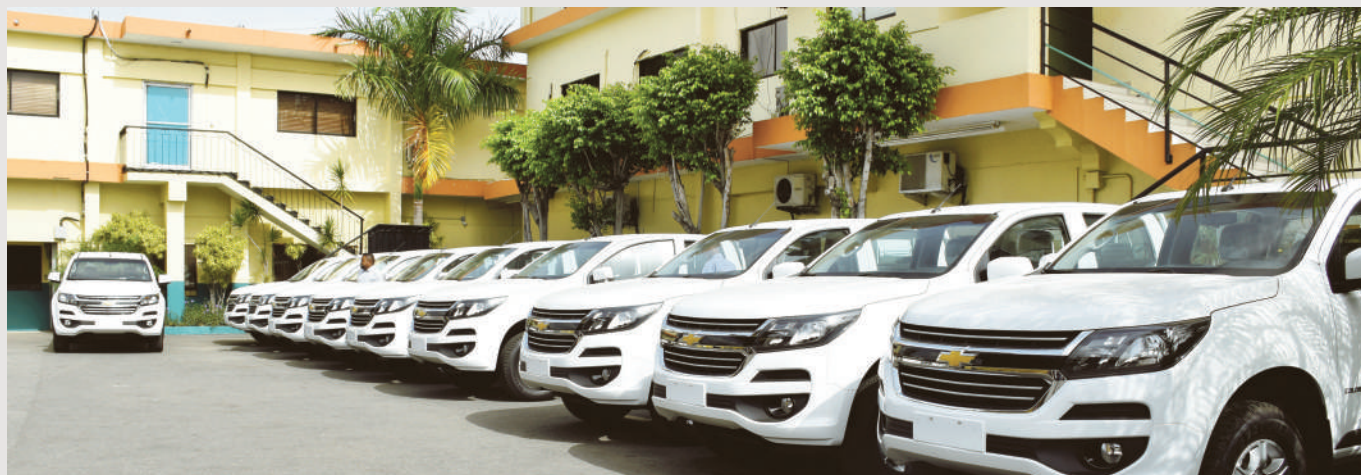
Nueva Flotilla de vehiculos.