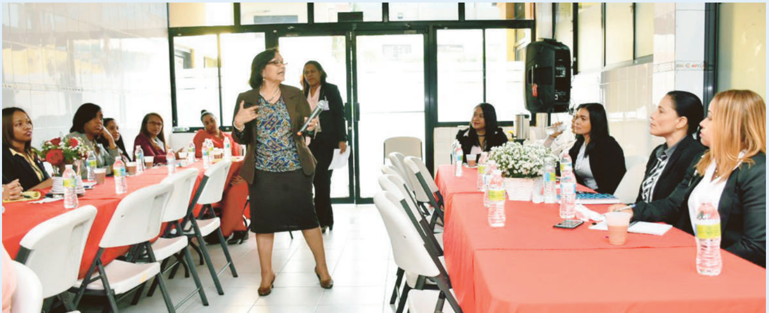
Taller de imagen a personal de protocolo y secretarias.