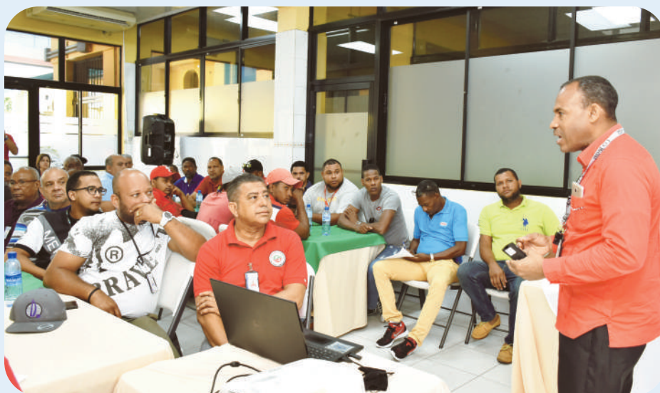
Taller Manejo Defensivo impartido por INFOTEP, el 4 de abril de 2018.

Cada trimestre, el Departamento de Recursos Humanos a través de la