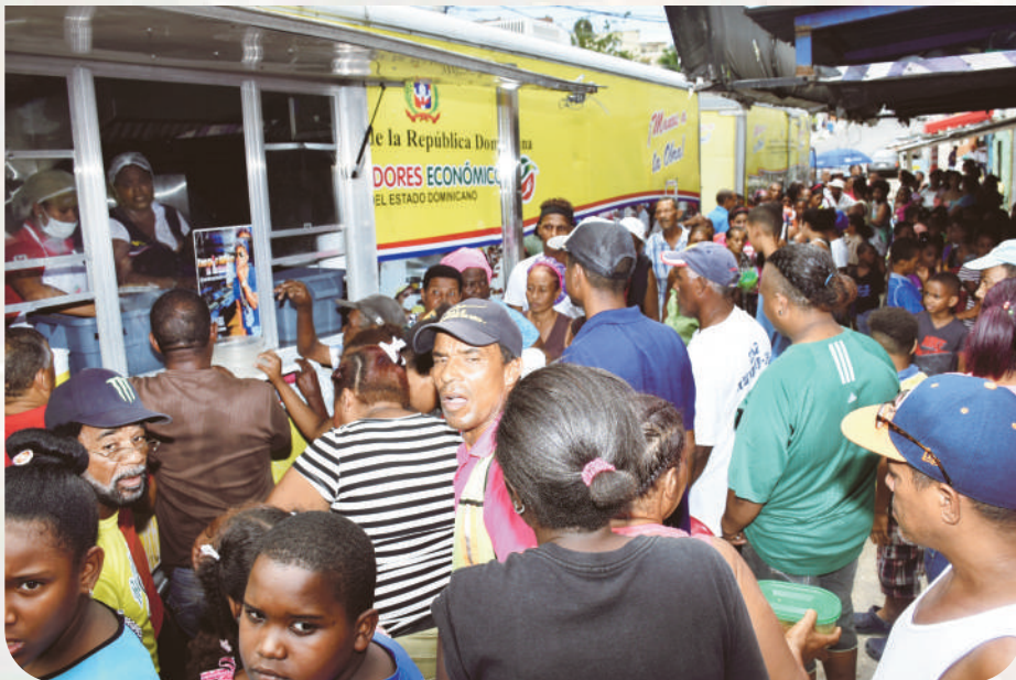
Comensales en nuestros centros fijos y en cocinas móviles.

la cobertura de la asistencia alimentaria a favor de los sectores más necesitados.