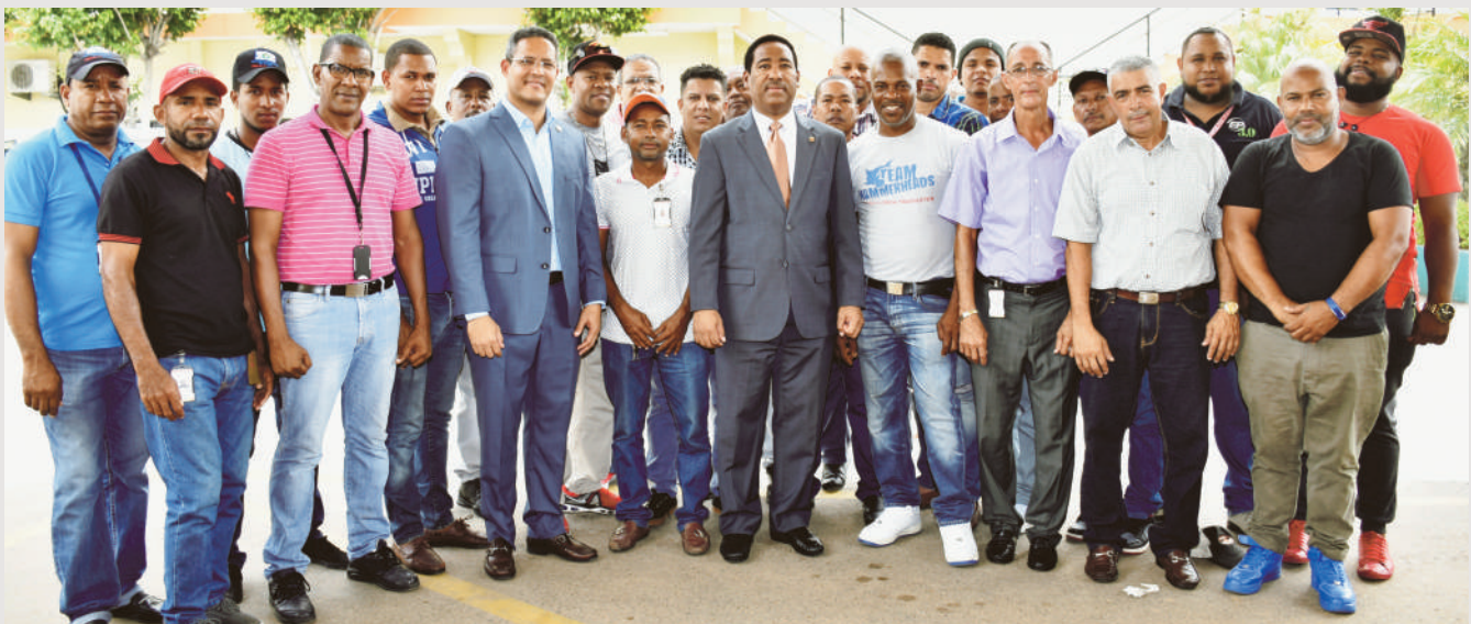
Parte del personal que labora en la Sección de Transporte.

Estos servidores se encuentran facultados en diferentes categorías para manejar las diferentes unidades vehiculares con que cuenta el organismo de ayuda social; además, constantemente son capacitados con cursos y talleres coordinados por la División de Evaluación del Desempeño y Capacitación de Recursos Humanos.