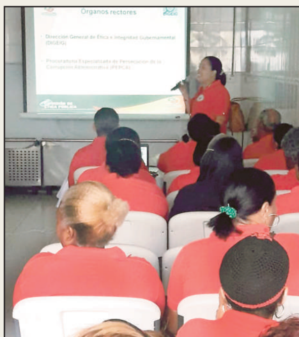
Sensibilización 28-9-18, desarrollo de lapresentacion.