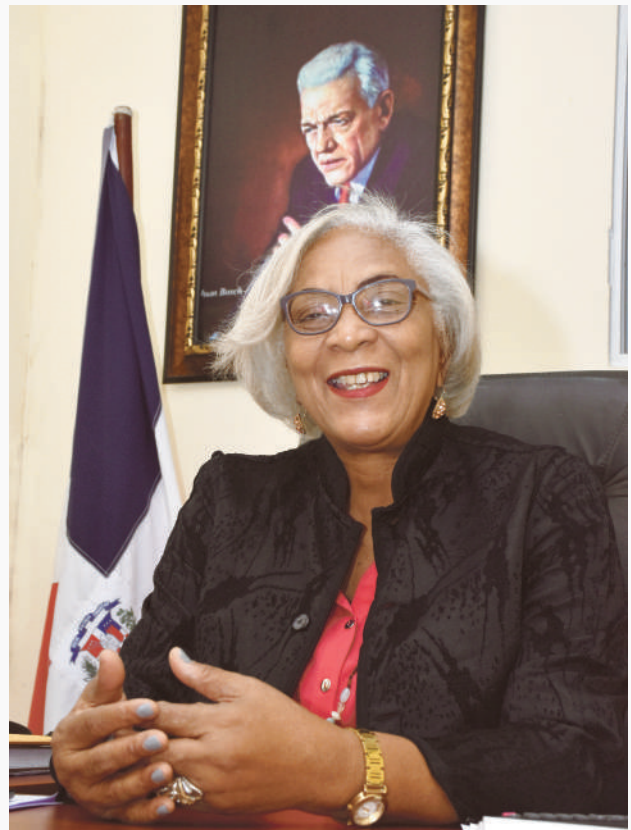
Altagracia González, gobernadora provincia Independencia

Altagracia González, gobernadora de la provincia Independencia, al ponderar la importancia de este nuevo comedor, explicó que desde éste se establecerán comedores de expendios en los bateyes 7, 8, y 9, ya que son zonas vul-