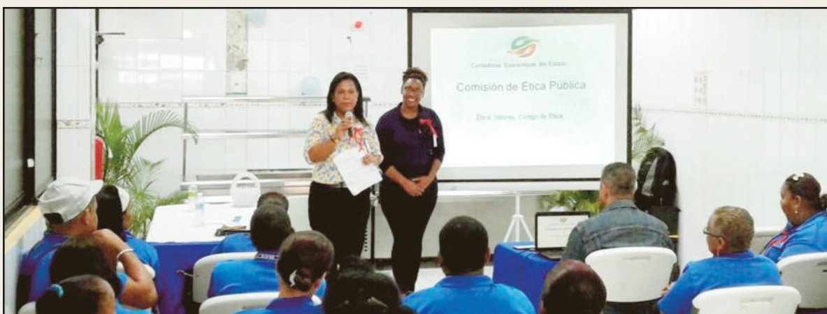
Sensibilización Ética. y filosofía institucional.

de promover y conservar entre los servidores de Comedores Económicos, el enfoque en un desempeño laboral ético, que implica contribuir cada día con su accionar al fortalecimiento de una administración pública, con actores comprometidos que entienden que vivir con valores, hacen mejores personas y es beneficio para todos.