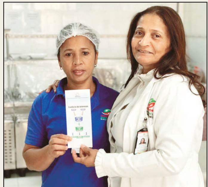
Sensibilización y distribución de brochure en cada departamento. Cocina General 12-7-18

Con estas y otras actividades concluyeron las acciones ejecutadas en el 2018, afianzando así el propósito