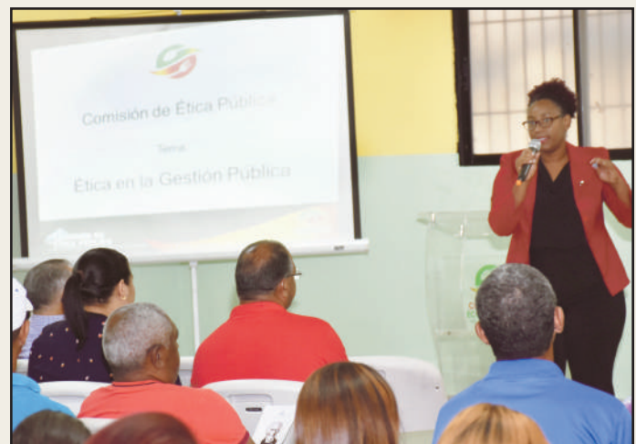
Sensibilización el 24-4-18. Tema Ética en la Gestión Pública.

de promover y conservar entre los servidores de Comedores Económicos, el enfoque en un desempeño laboral ético, que implica contribuir cada día con su accionar al fortalecimiento de una administración pública, con actores comprometidos que entienden que vivir con valores, hacen mejores personas y es beneficio para todos.