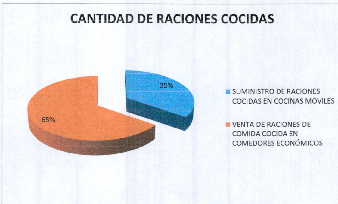
Grafica Distribución Porcentual de Raciones Cocidas